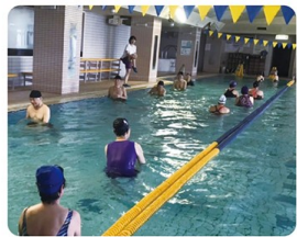
アクアウォーキング

アーサナ(ポーズ)、呼吸法、瞑想を中心に 行うことで身体の緊張を和らげ、心と身体 のバランスを整えていく。