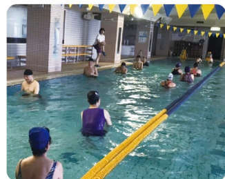
アクアウォーキング

音楽に合わせて体を動かす有酸素運動クラス。心肺機能や持久力の向上、脂肪燃焼が期待できます。