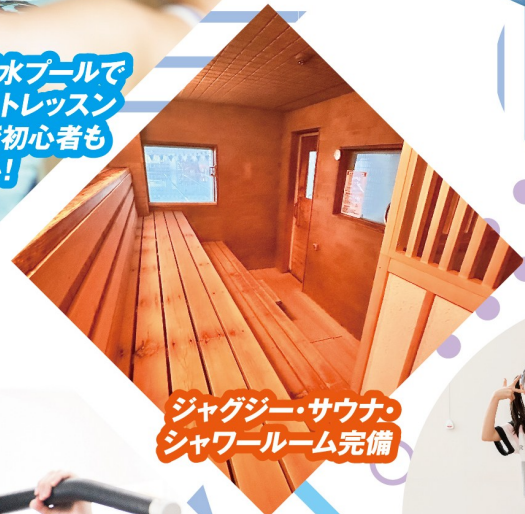
ジャグジー・サウナ・ シャワールーム完備